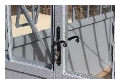
Zoom porte et serrure