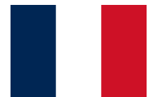
Conception & Fabrication françaises