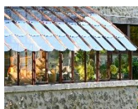
Zoom tuiles en verre trempé