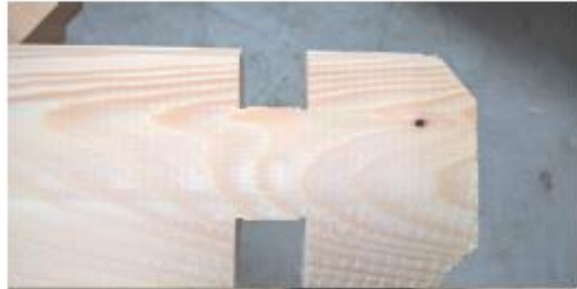
petits défauts d'usinage

Les défauts semblables à ceux présentés ci-contre sont acceptables. N'hésitez pas à poncer les éléments ayant des traces ou à supprimer les poches de résine à l'aide d'une spatule.