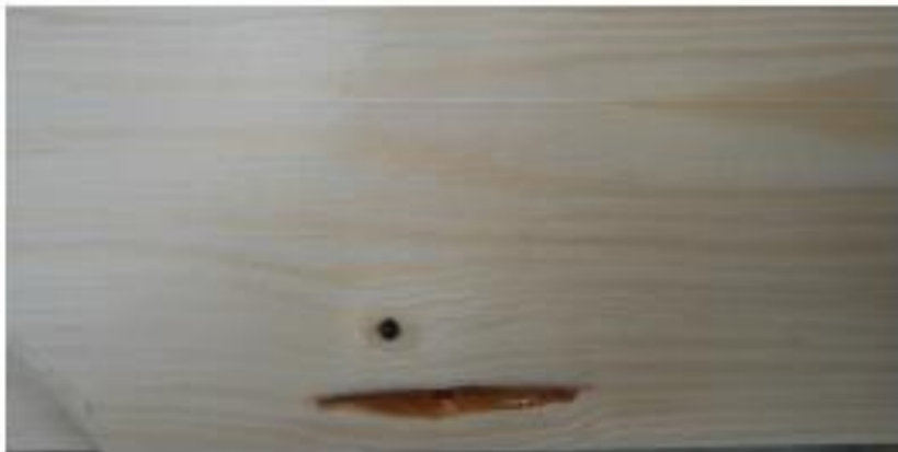
poche de résine