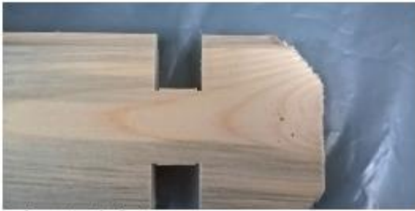
coloration du bois